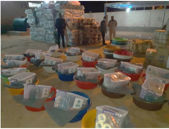
الهيئة الليبية للإغاثة، شريكة المفوضية، تقدم مواد الإغاثة الأساسية في مركز إيواء الكفرة في شرق ليبيا.

يستمر توزيع مواد الإغاثة الأساسية في المناطق الحضرية ومراكز الإيواء. في الأسبوع الماضي، وزع شركاء المفوضية منظمة تشيزفي (CESVI) والهيئة الليبية للإغاثة (LibAid) ومنظمة الإغاثة الدولية الأولية (PUI) مستلزمات النظافة والمراتب والبطانيات والصابون والمناديل والمصابيح الشمسية ومعقمات الأيدي على 344 شخصاً في المناطق الحضرية و 261 شخصاً في مراكز إيواء الكفرة والمرج وقنفودة في شرق ليبيا. حتى الآن تلقى هذا العام 17,049 لاجئاً وطالب لجوء مواد الإغاثة الأساسية.